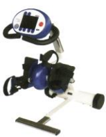
Flipper - klares Blau Standard

Diese Farben sind auf Anfrage erhältlich.