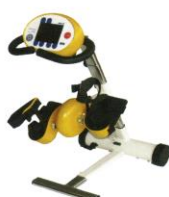
Skippy - warmes Gelb mit Aufpreis