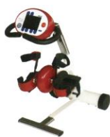
Speedy - sportliches Rot mit Aufpreis