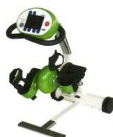
Dschungel - kräftiges Grün mit Aufpreis